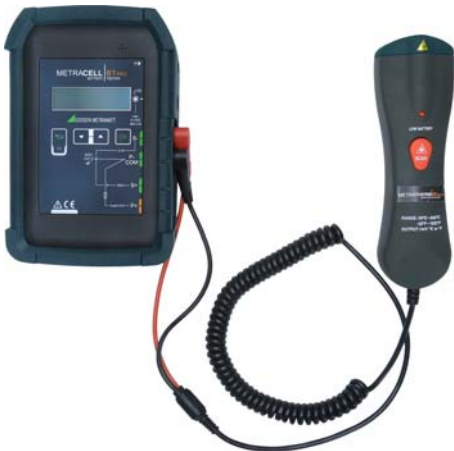
Bild 3: Batterieprüfgerät mit Temperatursensor METRATHERM IR BASE (Z680A)