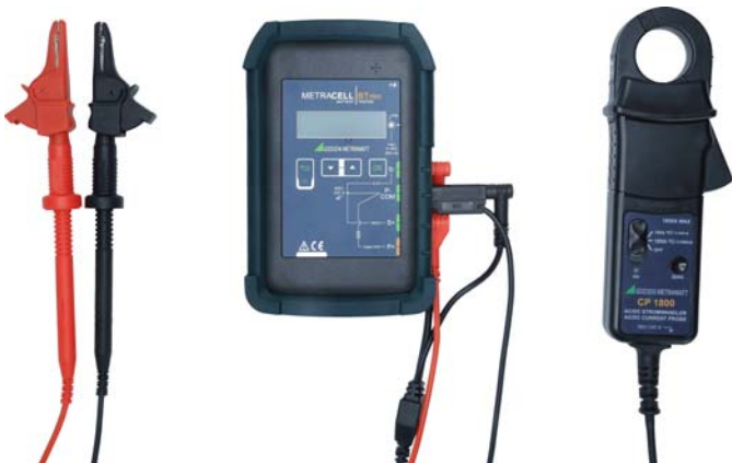
Bild 2: Batterieprüfgerät mit AC/DC-Zangenstromsensor CP1800 (Z204A)