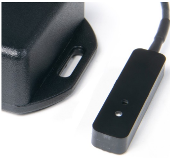
THP Sensor Detail