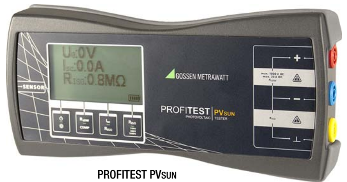
PROFITEST PV SUN