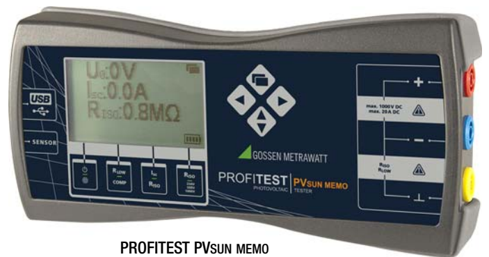
PROFITEST PV SUN MEMO