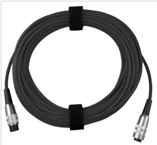
Verlängerungskabel für Pt100 (Z360E)