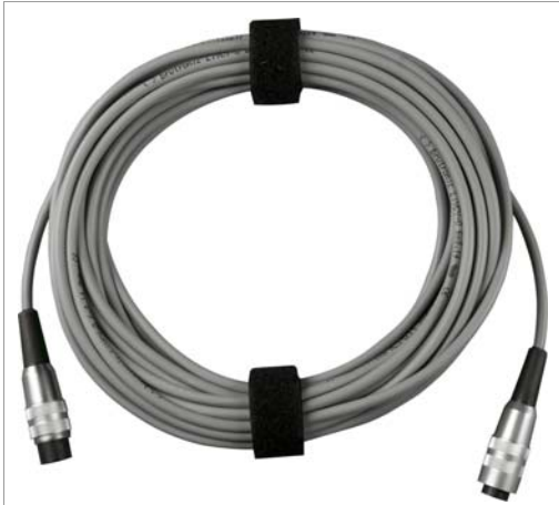
Verlängerungskabel für Referenz-Sensor (Z360F)