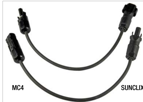
PV-Adapterset SUNCLIX-MC4 (Z360H)