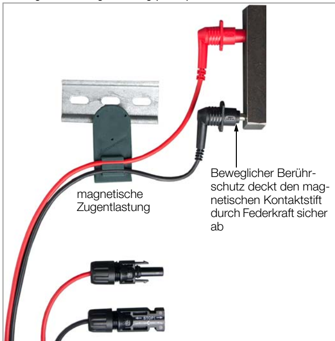
Magnetische Messspitzen (Patent) mit magnetischer Zugentlastung (Z502Y)